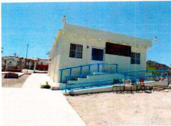
Imagen del Centro de Salud.

El día 03 de abril del año en curso se trasladó al Municipio de Guaymas sonora.